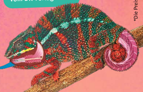
Illustration: Martina Leykamm

Blick ins Innere 3x buntes Sachbuch „Anatomie der Tiere“ vom DK Verlag