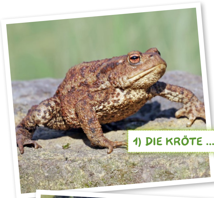
1) DIE KRÖTE ...

Wir erklären euch den Unterschied zwischen Frosch und Kröte. Aber wir brauchen eure Detektivarbeit: Wer ist es? Schreibe die richtige Zahl in die Kästchen.