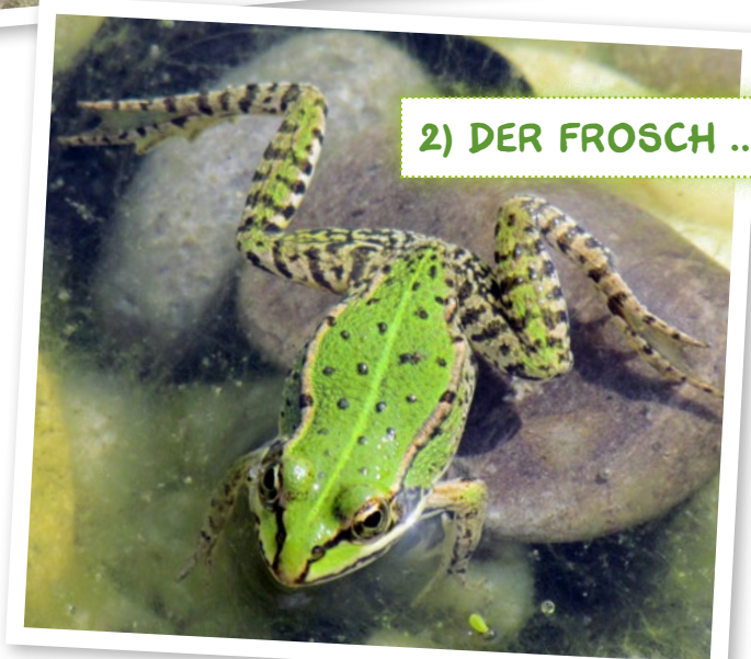
2) DER FROSCH ...