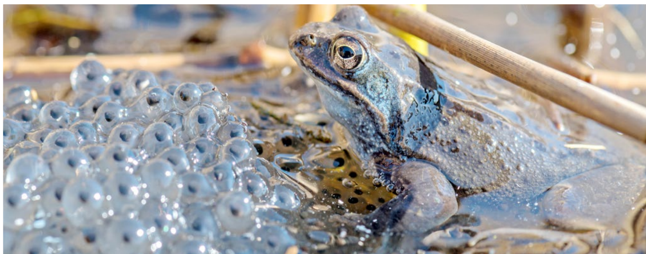
Die Eier nennt man Laich.